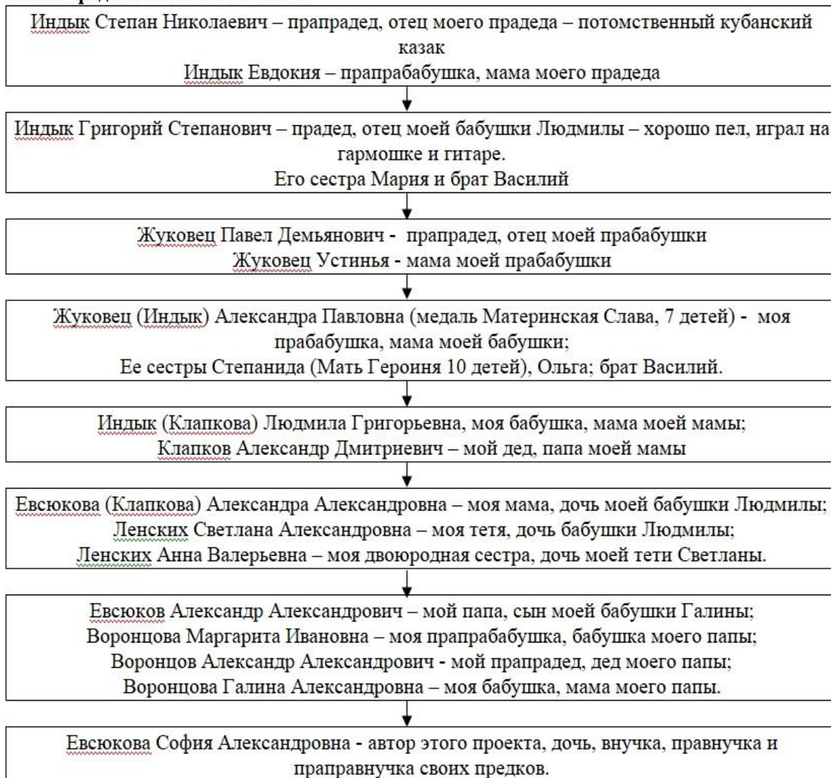
Схема родословной моей семьи.

В ходе подготовки проекта я смогла познакомиться с историей народной казачьей песни, с современными творческими коллективами. Кубанский казачий хор – хоровой певческий коллектив, основанный в 1811 году. Единственный в России профессиональный коллектив народного творчества, имеющий непрерывную преемственную историю с начала 19 века.