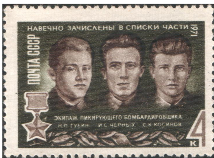
Рис. 4. Пример почтовых марок из серии Великой отечественной войны. 1971 год. Номер по каталогу 3898 В. Загорского

На рисунке 4 представлен пример почтовых марок из серии Великой отечественной войны (1971 год).