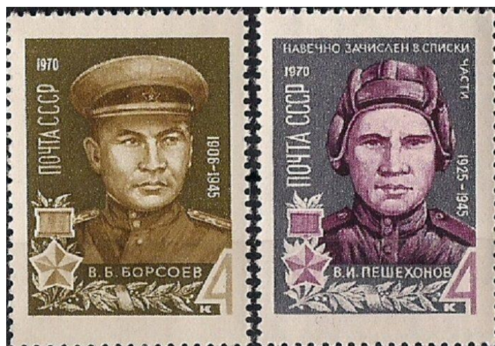
Рис. 3. Пример почтовых марок из серии Великой отечественной войны. 1970 год. Номер по каталогу 3779, 3780 В. Загорского

На рисунке 4 представлен пример почтовых марок из серии Великой отечественной войны (1971 год).