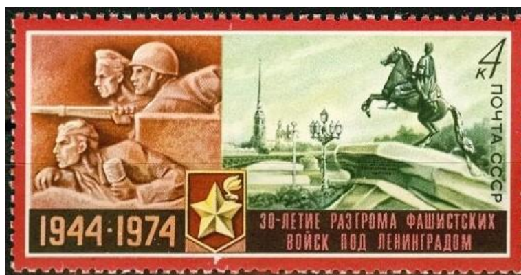
Рис. 5. Пример почтовых марок из серии Великой отечественной войны. 1974 год. Номер по каталогу 4254. В. Загорского