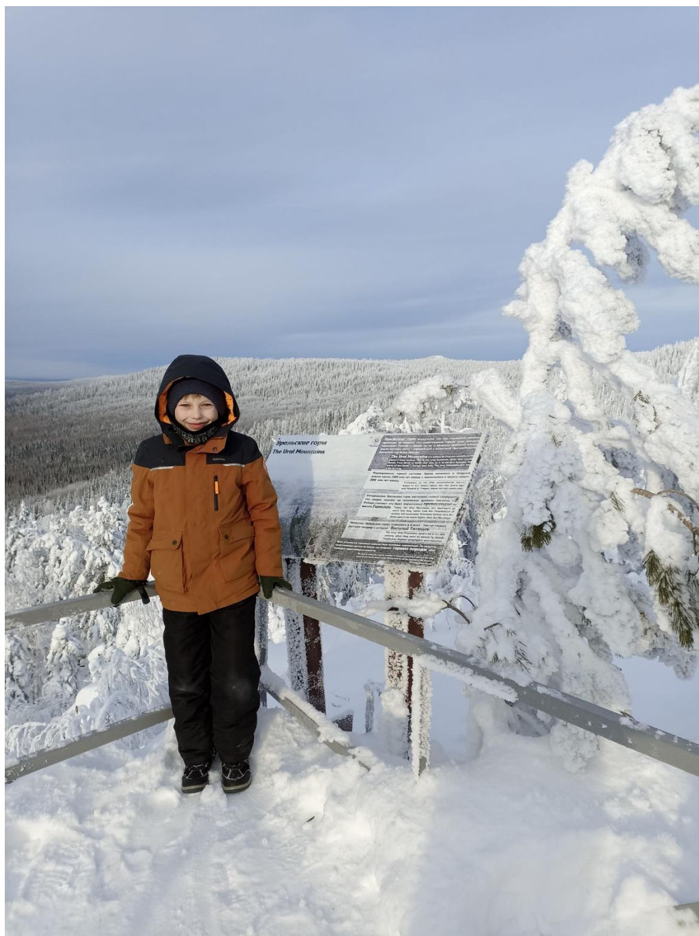
Рис.6. Фото на смотровой площадке на вершине горы Веселая

С высоты открывается вид на Висимский заповедник, гору Старик Камень, Сулёмское водохранилище и дорогу в деревню Большие Галашки.