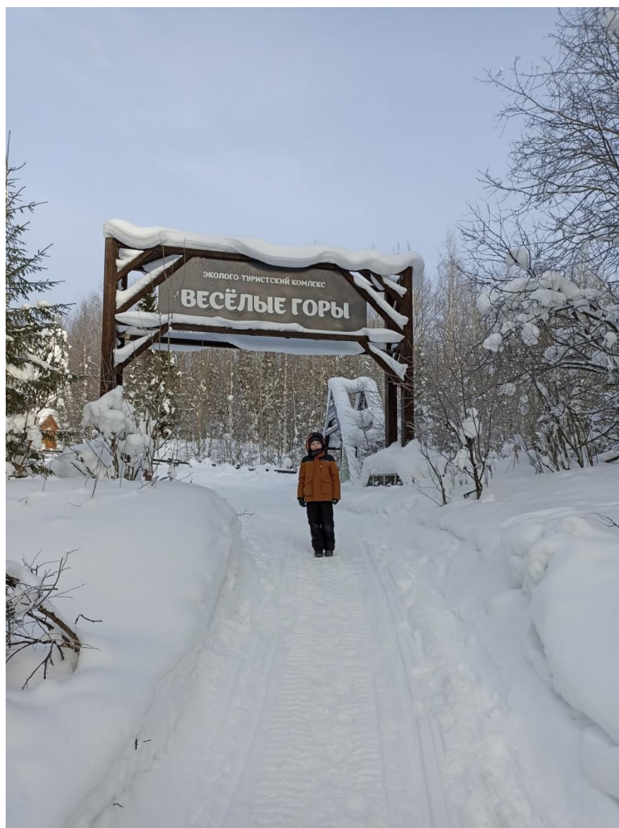
Рис.3 Фото начала экотропы «Веселые горы»

Деревянный настил экологической тропы длиной 1,3 км ведет путешественника к смотровой площадке на вершине горы Веселая высотой 625 метров над уровнем моря. На протяжении всего маршрута туристам встречаются информационные таблички, которые знакомят с флорой и фауной заповедника.