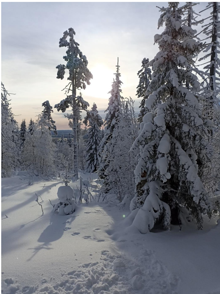
Рис.7. Фото по пути экотропы «Веселые горы»