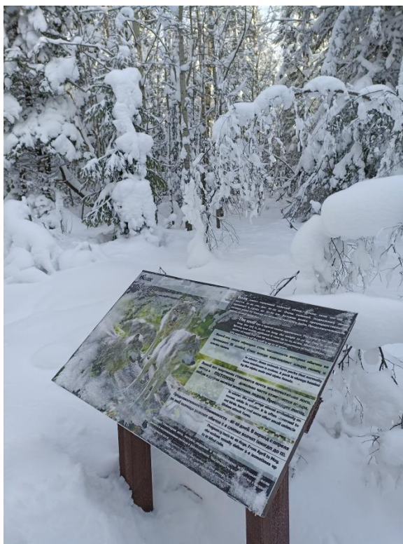
Рис.4. Фото инфомационных табличек

По пути прохождения маршрута меняются условия воздуха, влажность, чем выше, тем больше инея, структура снежинок меняется.