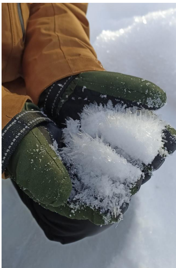
Рис.5 Фото снега на экотропе «Веселые горы»

По пути прохождения маршрута меняются условия воздуха, влажность, чем выше, тем больше инея, структура снежинок меняется.