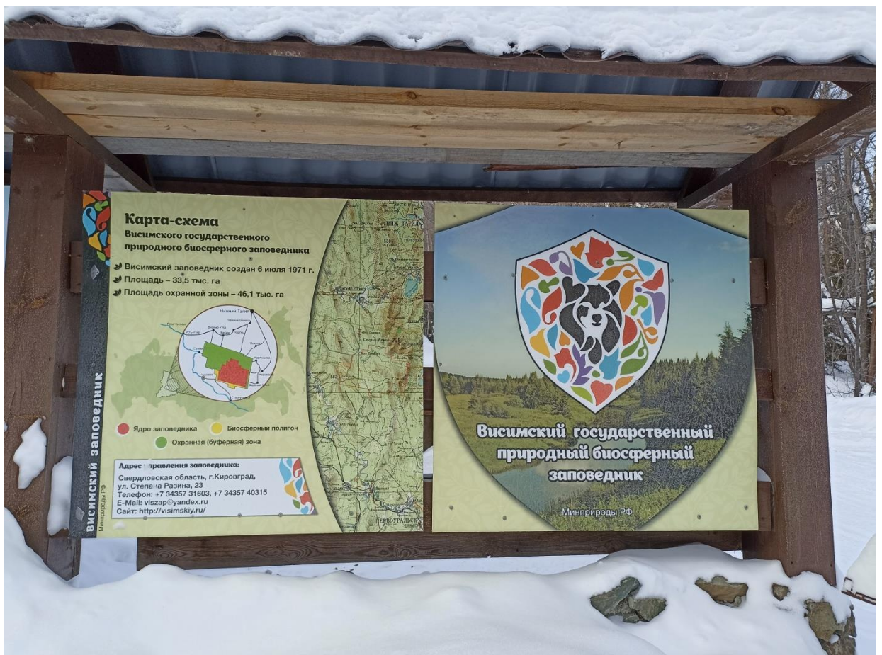
Рис.2. Фото информационного стенда перед въездом в заповедник