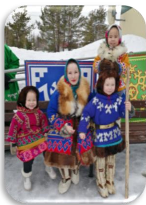
На фото моя мама и сестренки на празднике «День оленевода».

Родился я в семье ханты. Моя семья большая, очень крепкая и дружная. Нас пять человек: мама, папа, я и три сестрёнки. А ещё много родственников. В нашей семье все любят и уважают друг друга.