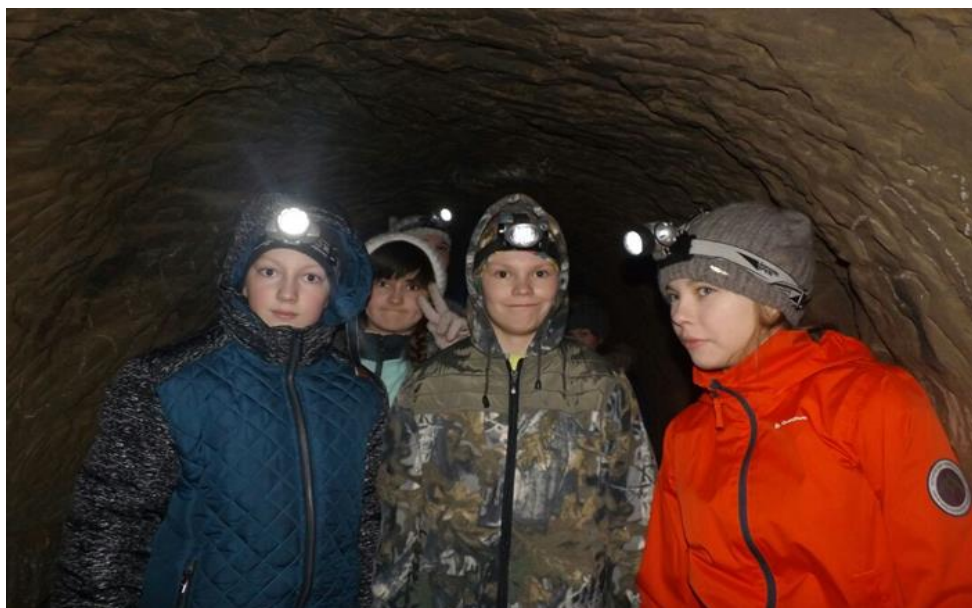
7. Внутри рудника – темно, но интересно