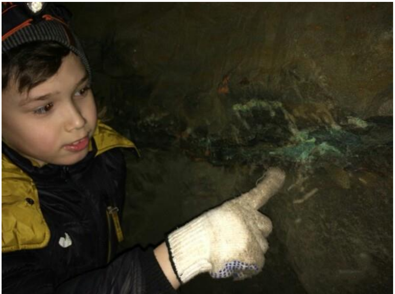
9. Жители рудника «Медный погреб»