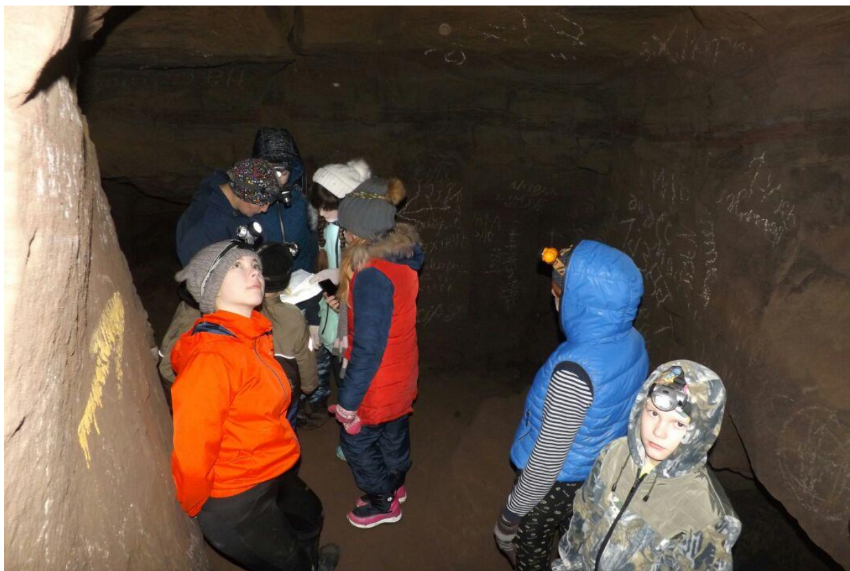
8. Зеленоватые прожилки – напоминание о добыче медной руды