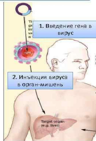
Рис.3.Генная терапия In vivo

3. Наконец, самый интересный, но при этом самый проблематичный, эмбриональный подход — редактирование генома эмбриональных клеток[8].