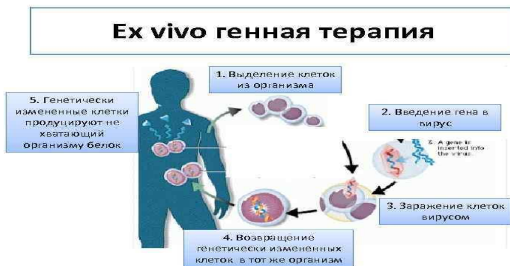
Рис.2.Генная терапия Ex vivo

1. Ex vivo. В этом случае клетки берут из организма пациента, модифицируют и вводят обратно. Этот метод хорош, когда клетки просто «достать» из тела и внедрить обратно. Например, при лечении заболеваний крови[1].