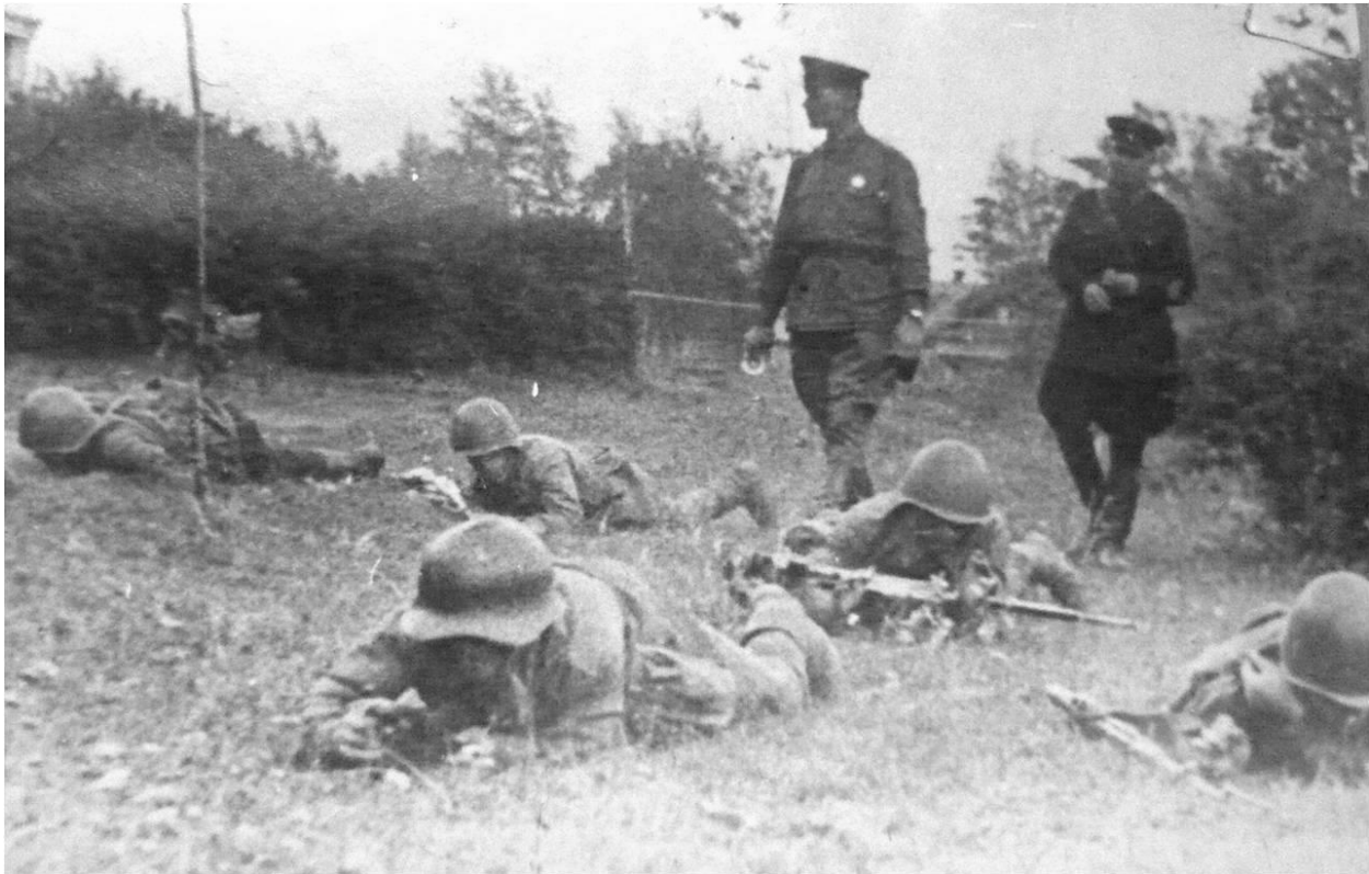
Приложение 7. В.А.Гнедин готовит танковые кадры для отправки на фронт.