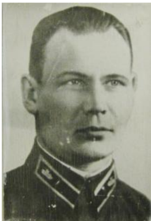
Приложение 11 К.П.Ушаков