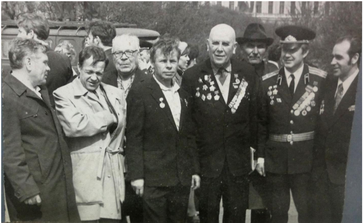
Приложение 20. Встреча фронтовых друзей в 1975 году на Марсовом поле в Ленинграде в день 30-летия Победы.