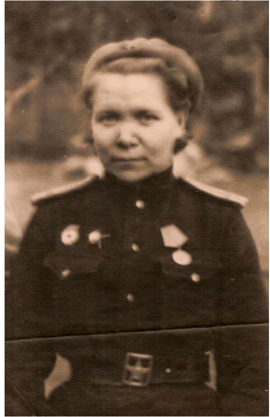
Приложение 2. Фаина Павловна Лаврова.