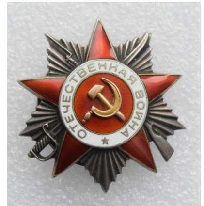
Приложение 23. Медаль «За оборону Ленинграда», Орден Красной Звезды, Орден Отечественной войны II степени

https://yandex.ru/search/?text=%D0%BC%D0%B5%D0%B4%D0%B0%D0%BB%D1%8C%20%D0%B7%D0%B0%20%D0%BE%D0%B1%D0%BE%D1%80%D0%BE%D0%BD%D1%83%20%D0%BB%D0%B5%D0%BD%D0%B8%D0%BD%D0%B3%D1%80%D0%B0%D0%B4%D0%B0%20%D1%84%D0%BE%D1%82%D0%BE&lr=2