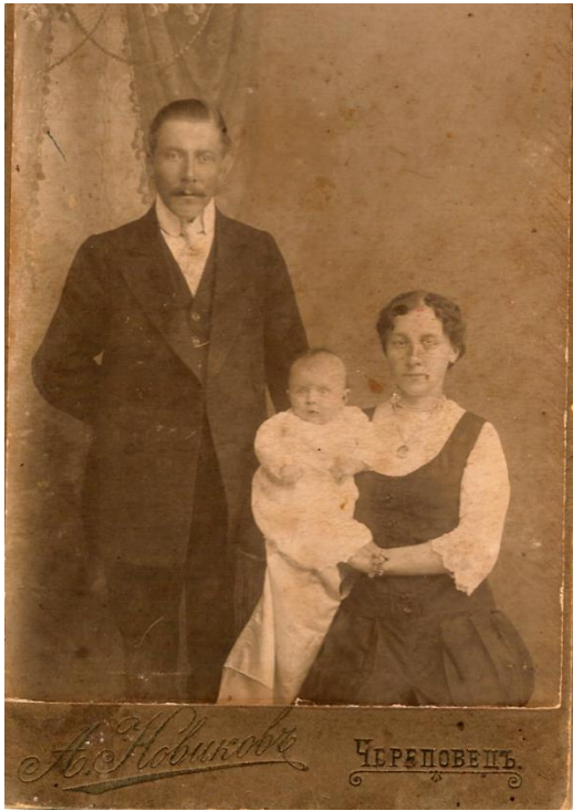
Приложение 4. Семья Лавровых.