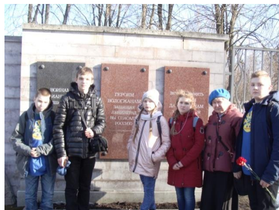
Приложение 30. Встреча поисковых отрядов клуба «Исток» г.Череповца и клуба «Поиск» 111 школы в марте 2019 года.