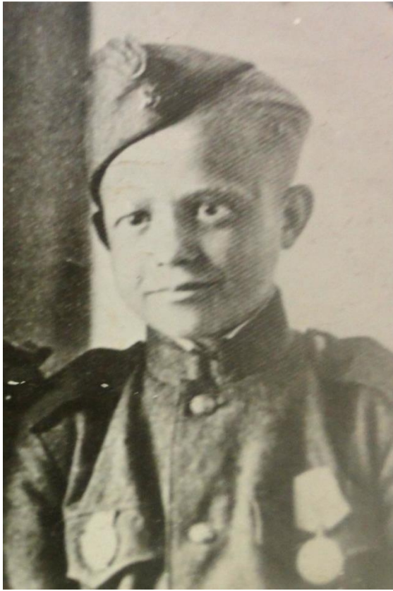
Приложение 15. Петр Судаков.