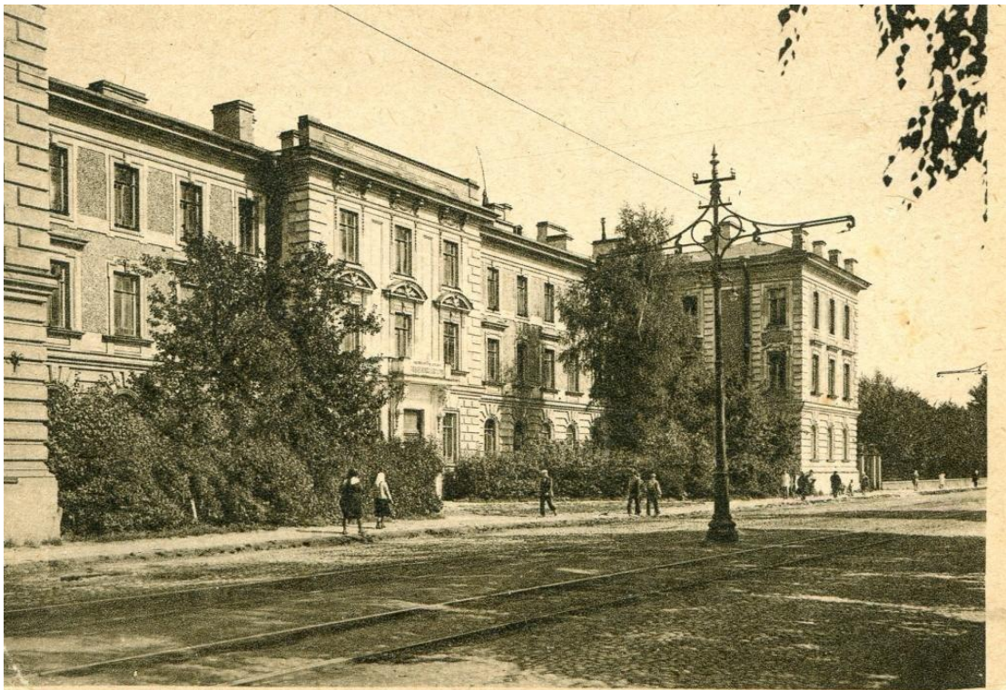
Приложение 6. 1-й медицинский институт. Ленинград

https://yandex.ru/search/?text=1%20%D0%BC%D0%B5%D0%B4%D0%B8%D1%86%D0%B8%D0%BD%D1%81%D0%BA%D0%B8%D0%B9%20%D0%B8%D0%BD%D1%81%D1%82%D0%B8%D1%82%D1%83%D1%82%20%D0%9B%D0%B5%D0%BD%D0%B8%D0%BD%D0%B3%D1%80%D0%B0%D0%B4&lr=2