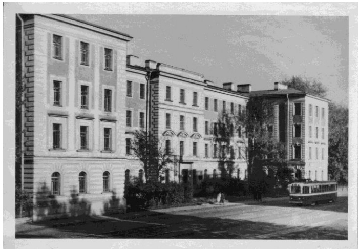
Приложение 5. 1-й медицинский институт. Ленинград

https://yandex.ru/search/?text=1%20%D0%BC%D0%B5%D0%B4%D0%B8%D1%86%D0%B8%D0%BD%D1%81%D0%BA%D0%B8%D0%B9%20%D0%B8%D0%BD%D1%81%D1%82%D0%B8%D1%82%D1%83%D1%82%20%D0%9B%D0%B5%D0%BD%D0%B8%D0%BD%D0%B3%D1%80%D0%B0%D0%B4&lr=2