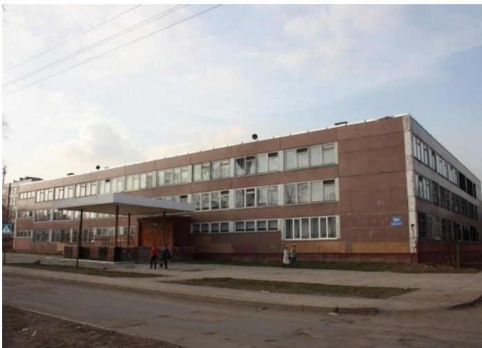
Приложение 25. Школа №1 г.Череповца

https://yandex.ru/images/search?from=tabbar&text=%D1%88%D0%BA%D0%BE%D0%BB%D0%B0%201%20%D0%B3.%D0%A7%D0%B5%D1%80%D0%B5%D0%BF%D0%BE%D0%B2%D1%86%D0%B0