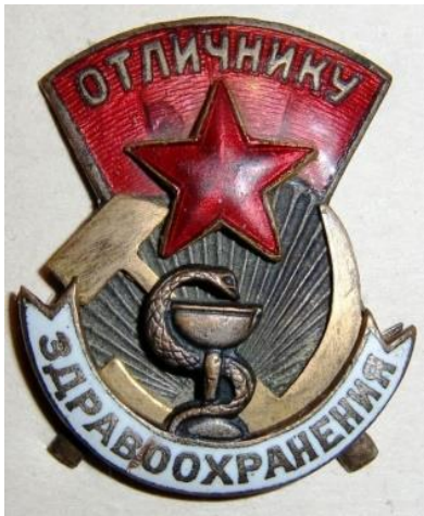
Приложение 21. Знак «Отличнику здравоохранения»

https://yandex.ru/search/?text=%D0%B7%D0%BD%D0%B0%D0%BA%20%D0%BE%D1%82%D0%BB%D0%B8%D1%87%D0%BD%D0%B8%D0%BA%D1%83%20%D0%B7%D0%B4%D1%80%D0%B0%D0%B2%D0%BE%D0%BE%D1%85%D1%80%D0%B0%D0%BD%D0%B5%D0%BD%D0%B8%D1%8F&lr=2