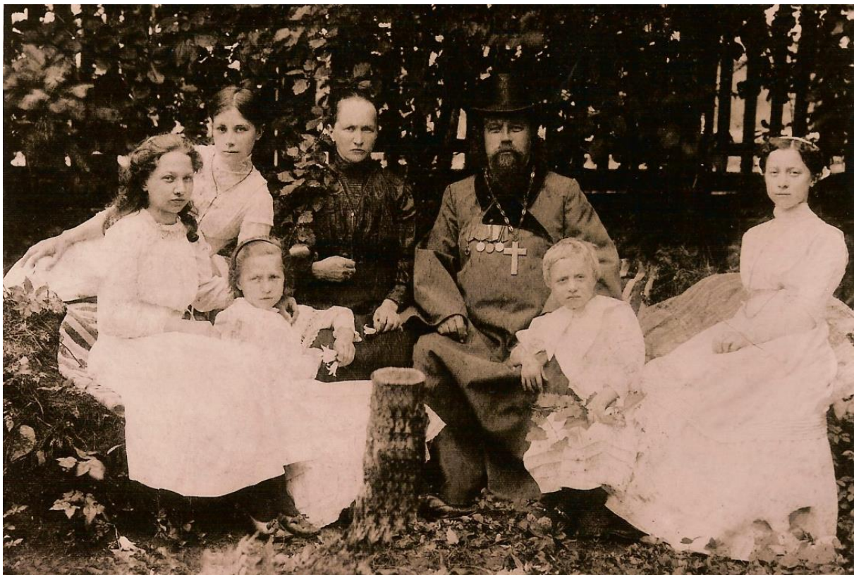
Приложение 3. Семья Лавровых.