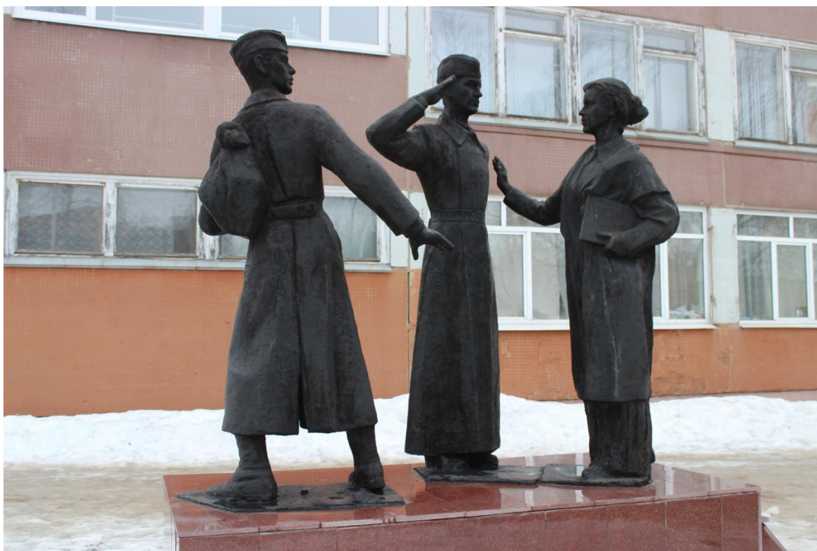
Приложение 27. Мемориал школы № 1 им. М. Горького г.Череповца, созданный с целью увековечить память об учителях и выпускниках первой школы, не вернувшихся с войны. https://memory-map.prosv.ru/#/memorial4092/type=map&center=59.12603,37.936308&zoom=13