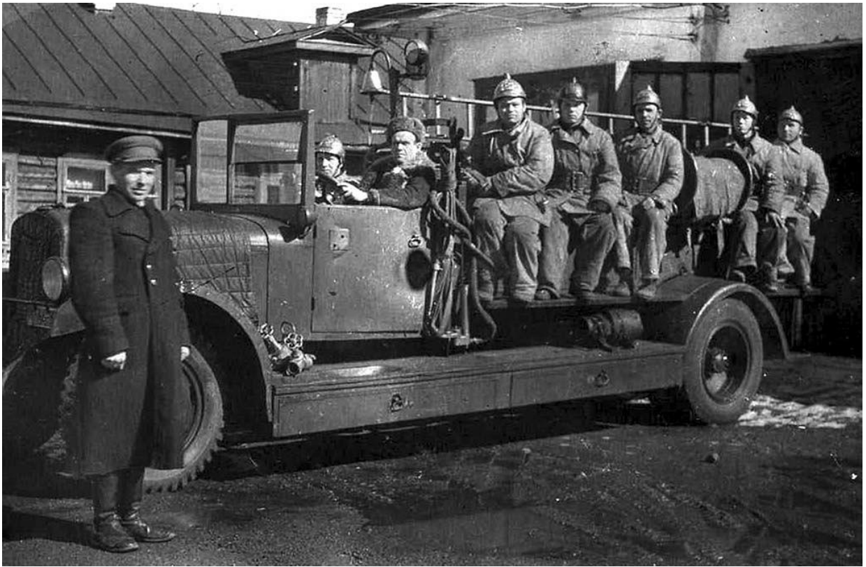
Изображение 7. Пожарная охрана в годы Великой Отечественной войны.

Основную тяжесть борьбы с пожарами, возникающими во время вражеских налетов, приходилось вначале вести малочисленным городским профессиональным и объектовым пожарным командам. Личный состав, переведенный с утра 22 июня на казарменное положение, работал без сна и отдыха. Важной задачей для пожарных было сохранение военных объектов, транспортных узлов и инфраструктуры, не допустить перерастания отдельных пожаров в массовые, ликвидировать или «зачернить» пожары до наступления ночи, чтобы они не служили ориентиром немецкой авиации. Пожарным помогало население прифронтовых городов, люди под огнем фашистской авиации постигали на практике науку тушения зажигательных бомб.