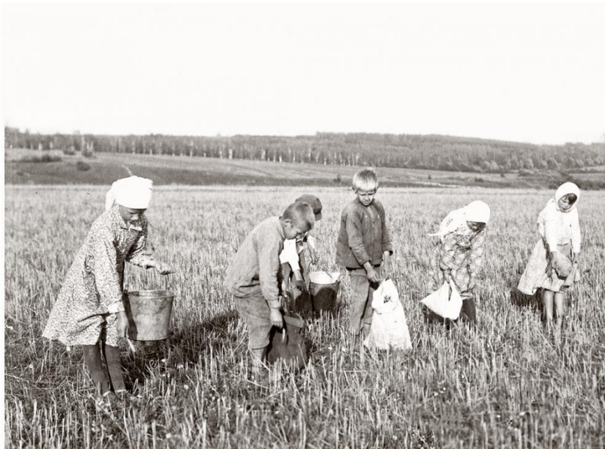
Рисунок 2. Дети собирающие колоски.

Но не только на заводах и фабриках ковалась великая победа. На полях и фермах колхозов женщины и дети проявляли запредельную выносливость и самоотверженность. Труженики тыла в годы войны на селе, содержали домашнюю скотину, получали от неё молоко и мясо, но сами этим не пользовались! Всё на фронт! Всё для победы!