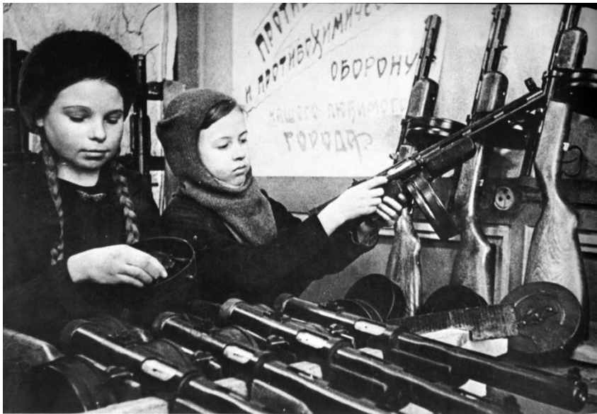
Рисунок 2. Девочки собирают ППШ.

Конечно, советским детям пришлось забыть про учебу на время войны, ведь фронту нужно оружие и снаряды.