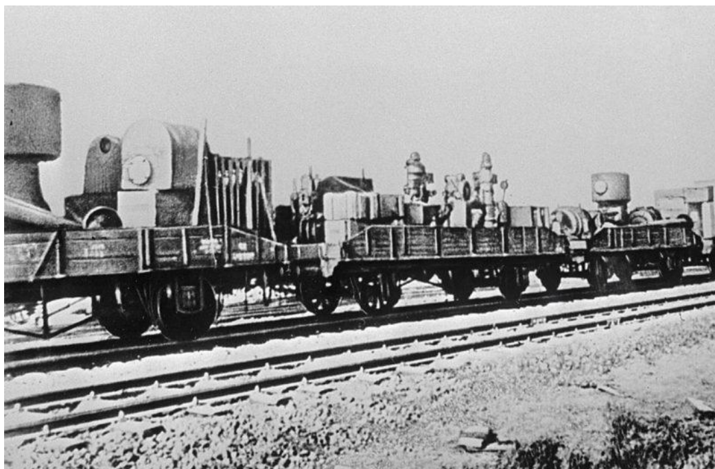
Изображение 6. Эвакуация советской промышленности во время ВОВ.

Уральский регион стал крупнейшим пунктом промышленной эвакуации, разместивший к осени 1942 г. на своей территории оборудование и рабочую силу более 830 предприятий, 212 из которых приняла Свердловская область. Прибывшие на Урал заводы и фабрики использовали три основных варианта своего обустройства: одни занимали помещения родственных по профилю предприятий; другие вынуждены были осваивать мало приспособленные к промышленному производству площади; третьи располагались на пустошах и сами возводили цеха и административно-управленческие корпуса.