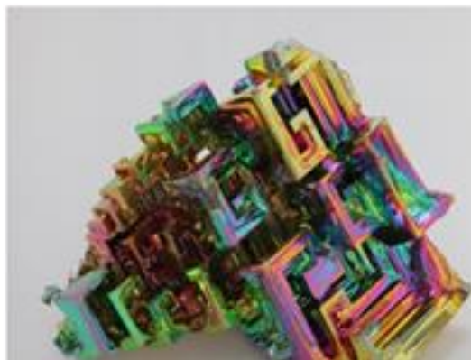
Рис. 3. Висмута кристаллы с оксидной пленкой

Происхождение слова «висмут» недостаточно ясно. По одной из гипотез, оно образовано от искаженных немецких слов wis и mat ( weiße Masse ) «белая масса». По другой — слово «висмут» — не что иное, как арабское «би исмид», то есть похожий на сурьму [5].