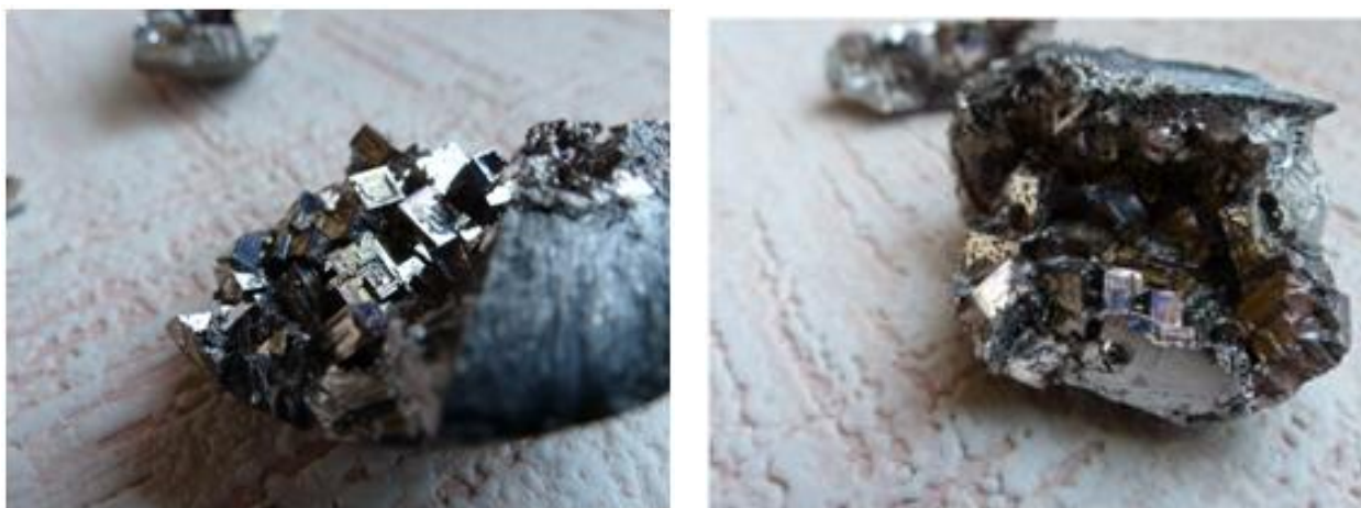
Рис.7. Кристаллический висмут

Такую красивую окраску кристаллы висмута приобретают в результате окисления поверхностного слоя металла, причем, чем выше чистота исходного металла, тем более красиво окрашивается кристалл.