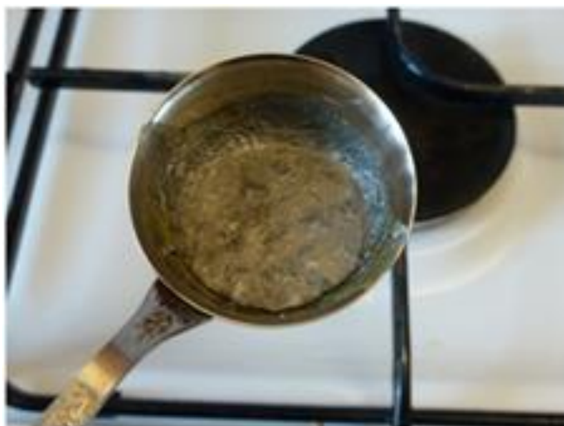
Рис.5. Оксидная пленка на жидком висмуте

Аккуратно удаляем ее, выключаем газ и оставляем жидкий металл медленно остывать.