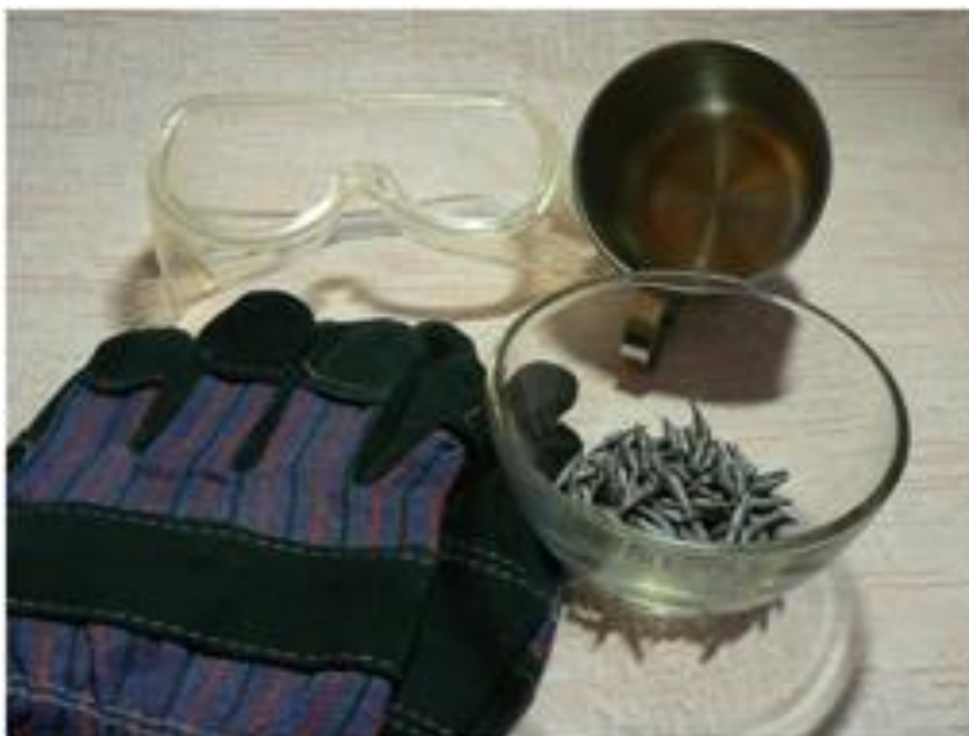
Рис.4. Оборудование и материалы

Для эксперимента нам потребуется очень чистый висмут. Чем он чище, тем красивее получатся кристаллы. У нас висмут химически чистый, в гранулах. При работе с расплавленным металлом мы будем использовать средства индивидуальной защиты: защитные очки и перчатки.