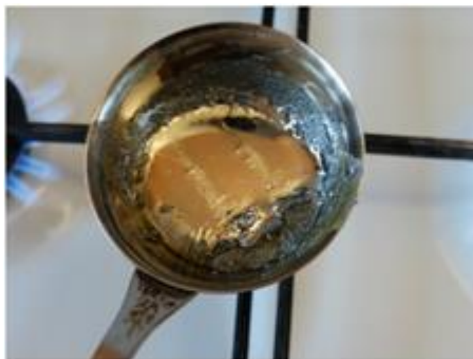
Рис.6. Поверхность жидкого лития после удаления оксидной пленки

Аккуратно удаляем ее, выключаем газ и оставляем жидкий металл медленно остывать.