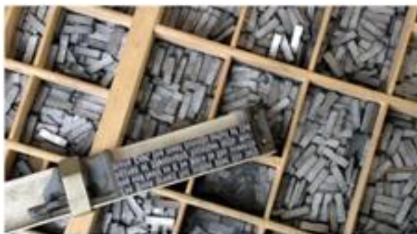
Рис.2 Шрифты наборные

В центральной России висмут известен с XV в. С развитием книгопечатания висмут вместе с сурьмой стали применять для изготовления типографских шрифтов.