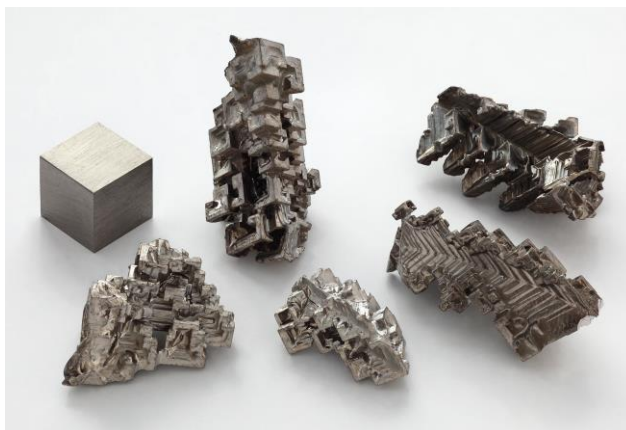
Рис.1 Кристаллы висмута

Висмут- Bi –серебристо-серый металл с розоватым оттенком. В природе существует один стабильный изотоп ^{209}\text{Bi} . Содержание висмута в земной коре 0.00002 % по массе, в морской воде – 0.00002 мг/л [1]. Висмут содержится в земной коре в виде минерала висмутин (висмутовый блеск) ( \text{Bi}_2\text{S}_3 ), самородный висмут, козалит \text{Pb}_2\text{Bi}_2\text{S}_5 , тетрадимит \text{Bi}_2\text{Te}_2\text{S} , бисмит \text{Bi}_2\text{O}_3 , бисмутин \text{Bi}_2\text{CO}_3(\text{OH})_4 .