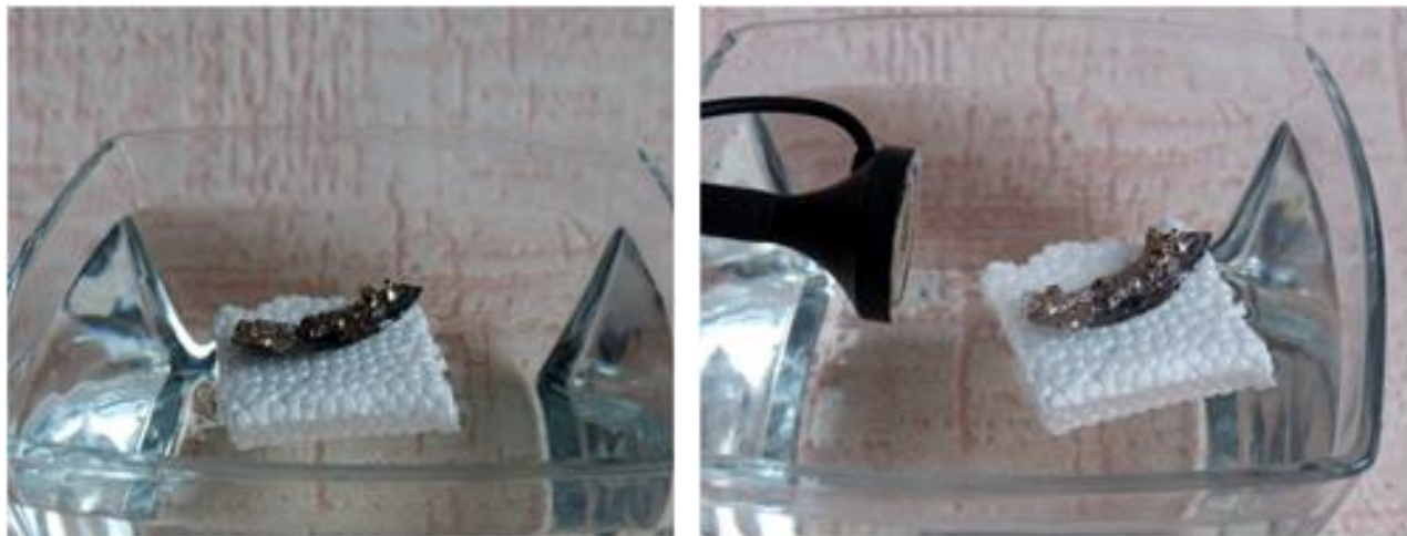
Рис.9. Воспроизведение эксперимента А. Бругманса

Можно положить кусочек висмута в маленький бумажный кораблик. Поставим его на воду и поднесем к нему магнит. Заметим, что кораблик станет уплывать от магнита.