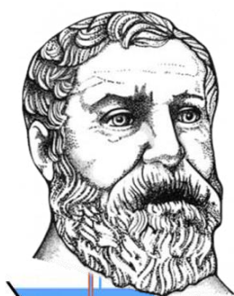
Рис. 1. Герон

Геронов фонтан состоит из открытой чаши и двух герметичных сосудов расположенных под чашей. Каждая емкость фонтана служит для определенной цели. Фонтан