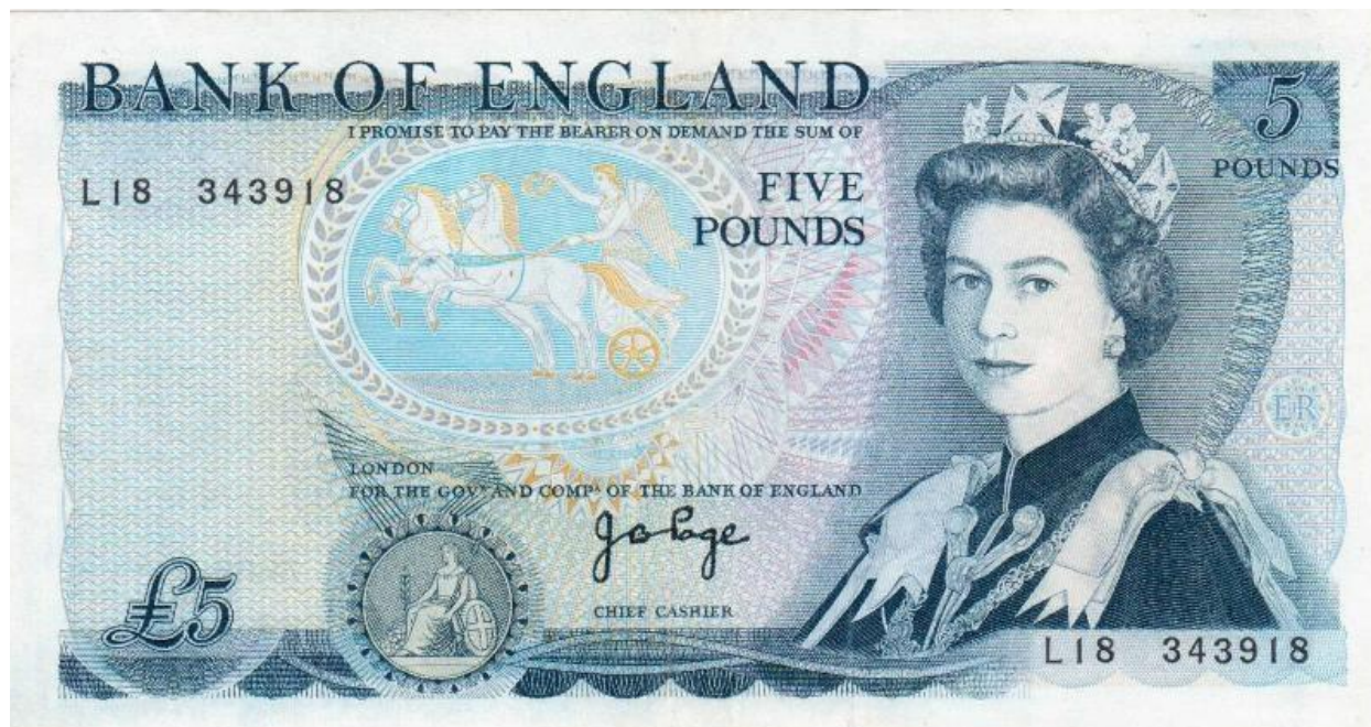
Рисунок 1 Купюра номиналом 5 фунтов с изображением фельдмаршала Артура Уэллсли, 1-го Герцога Веллингтона, в обращении – 1971-1990